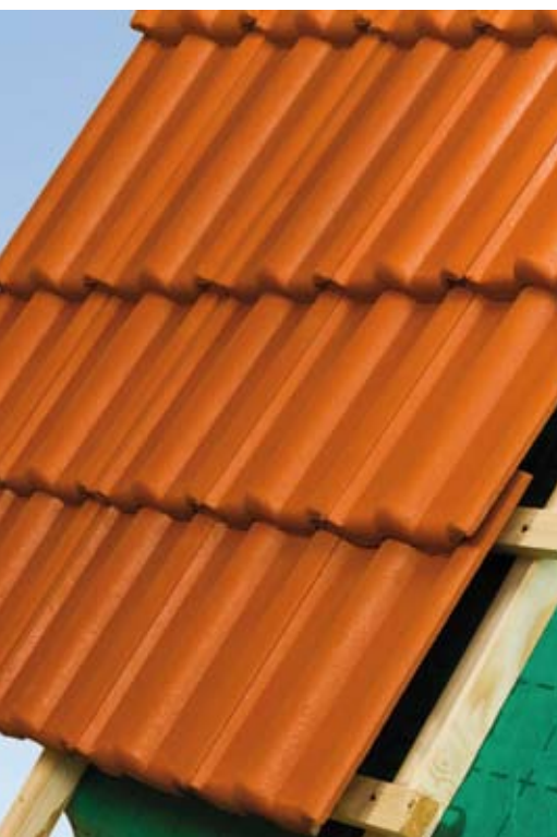
Effiziente Aufdachdämmung von Bramac.