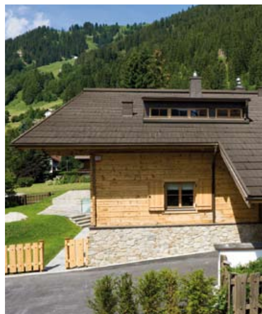
Dachpaneel aus Aluminium von Prefa.