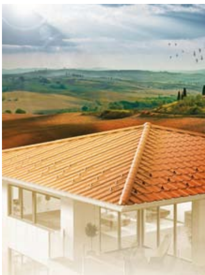
Dachplatte mit mediterranem Einschlag von Eternit