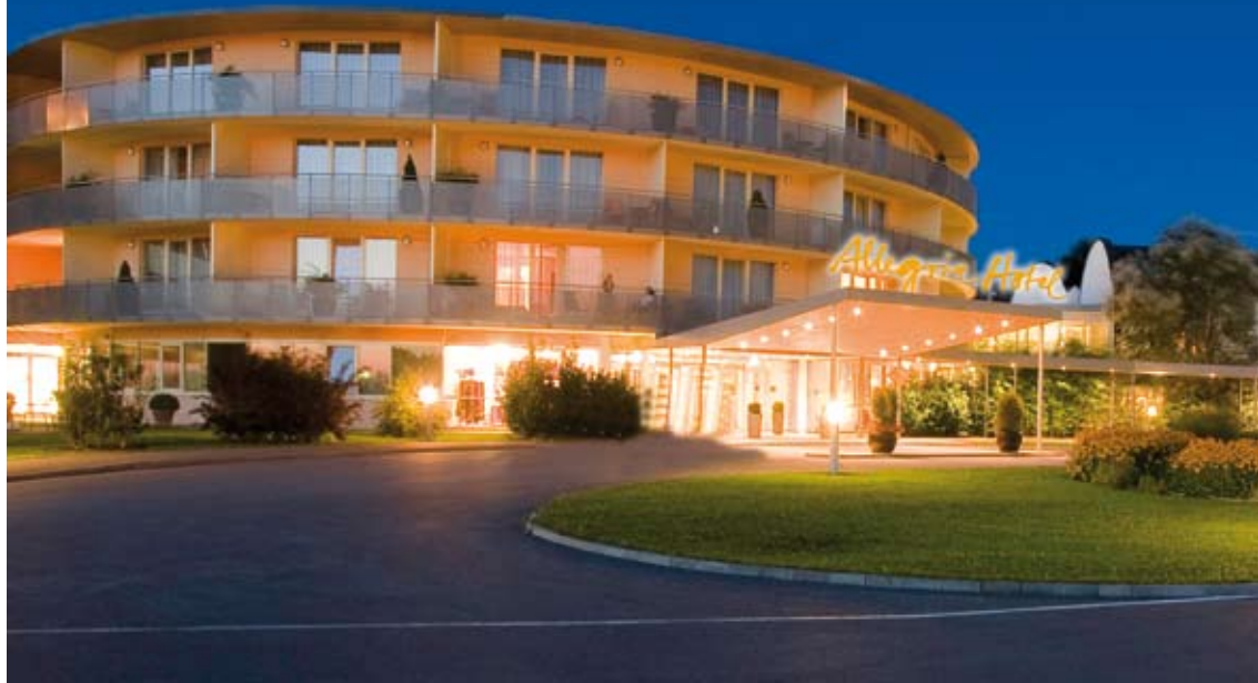
HOLZRONDEAU MIT EXTRAS. All-inclusive zum kleinen Preis macht den Urlaub erschwinglich.

Gastwirtschaft Zum Nussgart'l, 1200 Vorgartenstraße 80; Tel.: 01/33 25 125 www.nussgartl.at