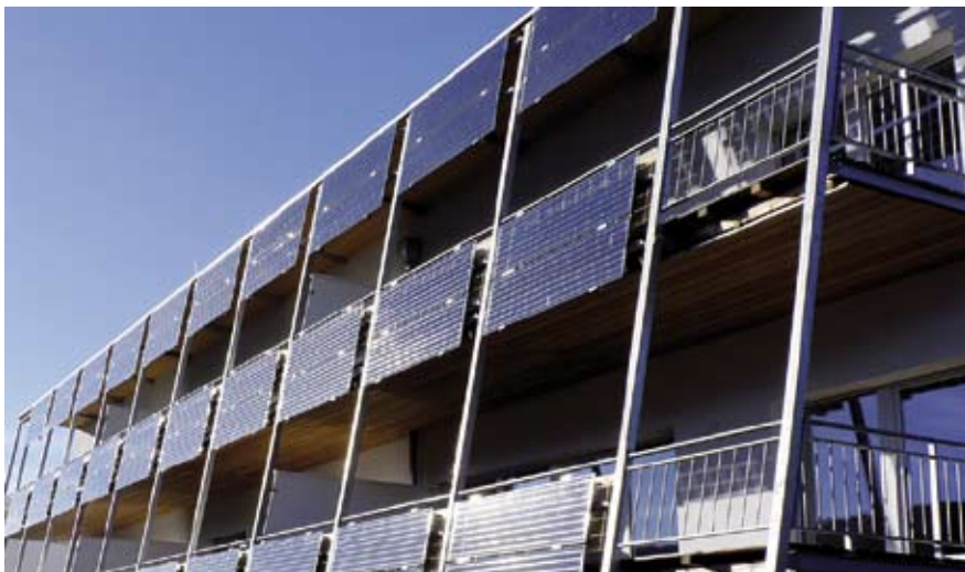
Im Sommer ist Verschattung Thema Nr. 1. Hier übernimmt Photovoltaik eine zentrale Rolle. Denn sie wirkt als Energiespender für die Schatten spendenden PV-Module.