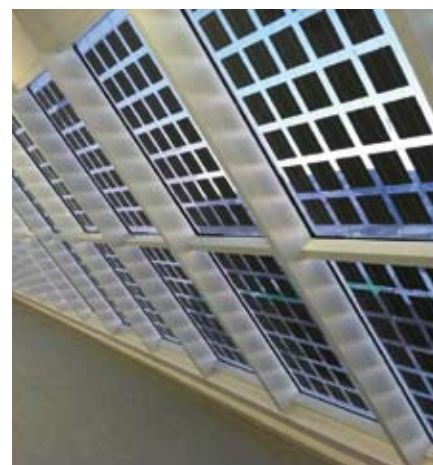
Moderne Architekturlösungen haben in Österreich laut Klima- und Energiefonds einen hohen Stellenwert. Semitransparente PV-Fassaden bilden dabei einen Bereich der GIPV.

form gebracht werden, was einen sehr aufwendigen Schritt hinsichtlich Energie und Know-how darstellt, aber der Energiebedarf konnte in den letzten Jahren erheblich reduziert werden. Aussagen, dass sich der Wafer selbst energetisch nicht amortisiert, stimmen nicht mehr.«