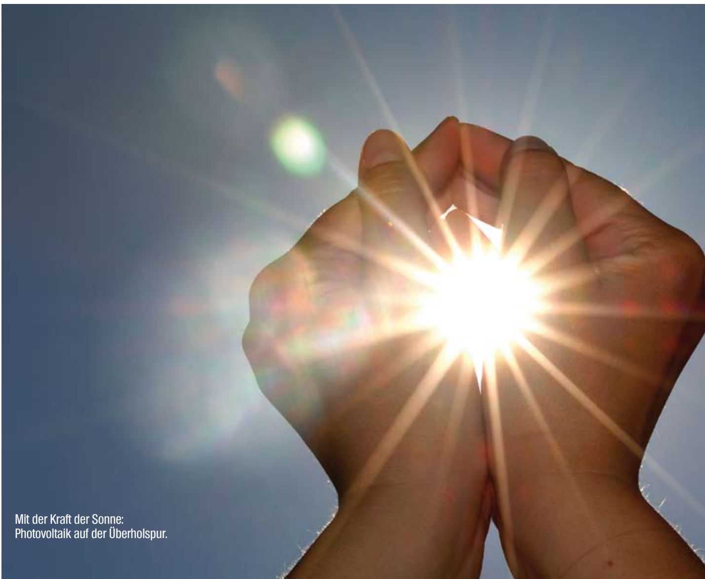
Mit der Kraft der Sonne: Photovoltaik auf der Überholspur.