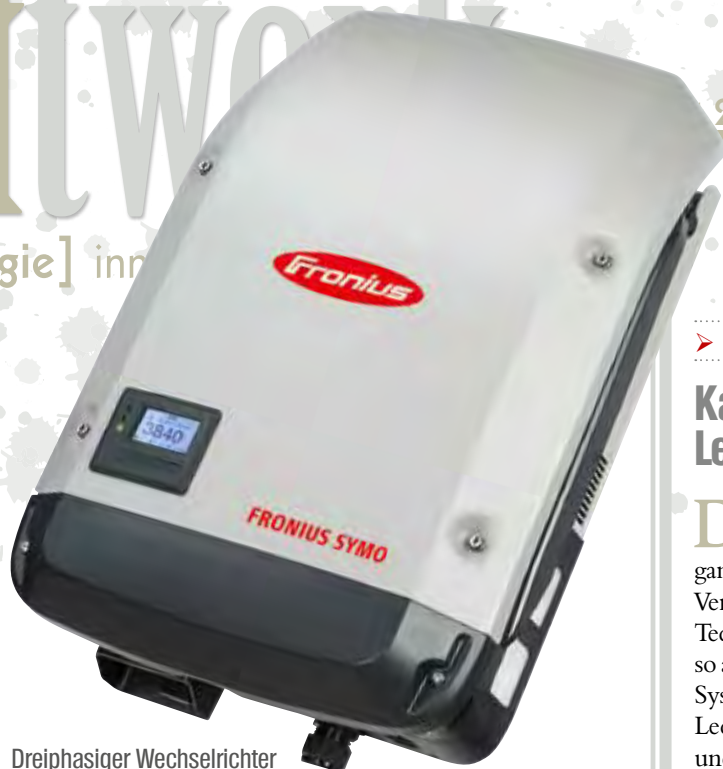
Dreiphasiger Wechselrichter »Fronius Symo« mit 3,0 bis 8,2 kW Leistung.

Das neue digitale Oszilloskop RTE von Rohde & Schwarz steht in Bandbreiten von 200 MHz bis 1 GHz zur Verfügung. Mit einer Erfassungsrate von mehr als einer Million Messkurven pro Sekunde findet es Signalfehler sehr schnell. Das punktgenaue digitale Triggersystem ohne nennenswerten Trigger-Jitter sorgt für präzise Messergebnisse. Zusätzlich