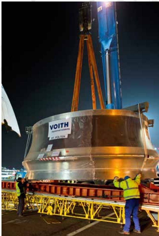
Voith transportiert ein 73 Tonnen schweres Laufrad per Flugzeug zum Wasserkraftwerk Bratsk in Sibirien