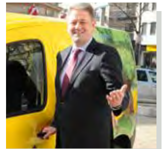
Minister Andrä Rupprechter präsentierte weitere klima:aktiv-Projekte im Mobilitätsbereich. Die Post AG ist bereits als Partner an Bord.

Verkehrsmanagement sollen auch für Sensibilisierung in der Bevölkerung sorgen. »Tausende klima:aktiv-Partner sparen bereits mehr als eine halbe Million Tonnen CO2 pro Jahr mit umweltfreundlichen Fuhrparks, E-Mobilität, Mobilitätsmanagement für den Ausbau des Radverkehrs und innovativen Mobilitätslösungen ein. klima:aktiv mobil ist nicht nur gut für unser Klima, die Investitionen stärken auch Wirtschaft und Gemeinden«, betont Umweltminister Andrä Rupprechter.