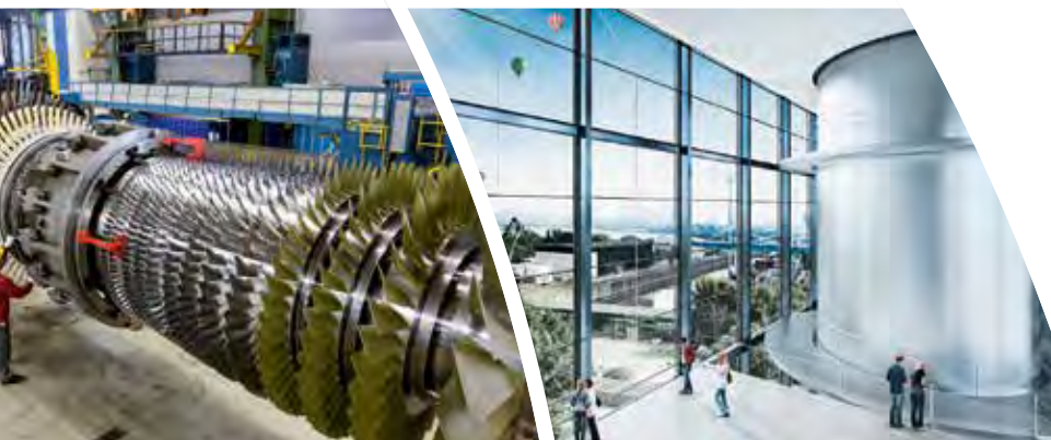
Die transparent gestaltete Fassade des Kraftwerks Lausward wird ein Blickfang in Düsseldorf.

Der neue Block »Fortuna« in Düsseldorf kann zudem kurzfristig auf einen Brennstoffwechsel und auf verschiedene Gasqualitäten eingestellt werden, ohne dass sich Anlagenleistung und Wirkungsgrad wesentlich ändern. So könnte auch methanisierter Wasserstoff zum Einsatz kommen – gegebenenfalls noch gemischt mit Erdgas oder aufbereitetem Biogas. Das neue Kraftwerk könnte so theoretisch ein zweites Leben als Erneuerbare-Energie-Anlage bekommen. Auch die Integration des Kraftwerks in das Stadtbild ist den Düsseldorfern ein wichtiges Anliegen. Die Gestaltung der Fassade wurde in einem Wettbewerb ausgeschrieben. Das Architekturbüro kadawittfeldarchitektur bekam den Zuschlag für ein Konzept aus Stahlrahmen, das den Gebäudeteilen ein gemeinsames Kleid verleiht, inklusive Aussichtsplattform. Nachts beleuchtete Fugen werden zum Logo für den Energieversorger der Stadt.