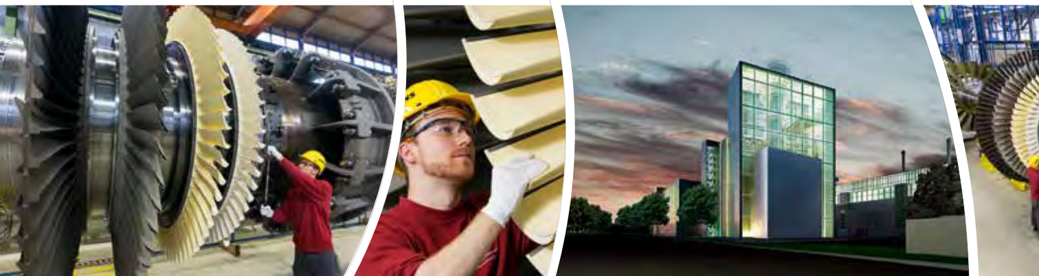
Arbeiten an der weltmeisterlich effizienten Gasturbine SGT5-8000H und ihre Montage im Gasturbinenwerk Berlin.

Ein Gas- und Dampfturbinen-Kraftwerk in Düsseldorf, das derzeit von Siemens errichtet wird, strebt gleich drei Weltrekorde an. In der Türkei wird eine weitere Anlage mit ähnlicher Technologie gebaut – mit Beteiligung aus Österreich.