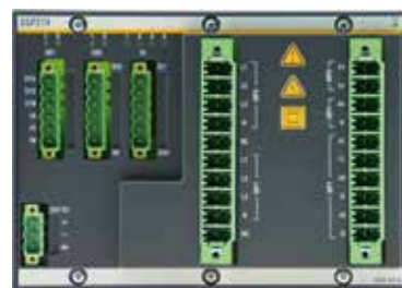
Das Modul Bachmann M1 GSP274 für Netzregelung auf höchstem Niveau.

rungssystem zur Verfügung. Als Einsteckoption für die betriebsführende SPS kombiniert es parametrierbare Standardfunktionen mit der freien Programmierbarkeit und Flexibilität des Modularensystems. Separate Geräte für Netzmessung, Synchronisation und Schutz entfallen ebenso wie Integrationsaufwände und Schnittstellenprobleme. Im Projektierungswerkzeug SolutionCenter sind Konfiguration, Inbetriebsetzungs-Diagnose und Störfallanalyse durch intuitive grafische Oberflächen realisiert. Das Modul GSP274 wurde vom