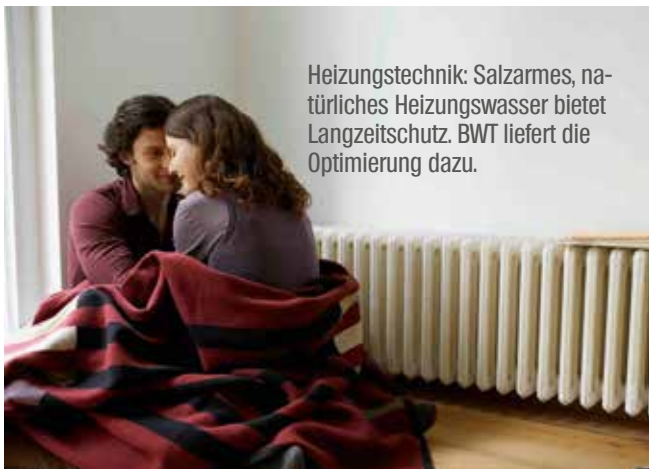
Heizungstechnik: Salzarmes, natürliches Heizungswasser bietet Langzeitschutz. BWT liefert die Optimierung dazu.

Wasser hat über einen Zeitraum von meist 20 bis 30 Jahren eine zentrale Funktion als Wärmeträger von Heizungsanlagen. Die Erstbefüllung der gesamten Heizungsanlage ist damit entscheidend für den Wirkungsgrad des Systems. Salzarmes, natürliches Heizungswasser ohne Chemie verhindert Ablagerungen, Schlamm, Gase und Korrosionen – und sorgt so für die reibungslose Funktion und einen hohen Wirkungsgrad. Best Water Technology (BWT) bietet dazu ein »AQA therm Heizungswasser«-Schutzprogramm: Dank abgestimmter Produkte wird das Füll- und Ergänzungswasser von Heizsystemen optimal aufbereitet. Die Lösung von BWT vermeidet Störungen durch Kalkablagerungen, Schlammansammlungen und mitgeführte Luft in der Anlage: Das spart zudem Heizkosten. Der Heizungswasserschutz trägt auf lange Sicht auch Werterhalt eines Gebäudes bei, denn ein gut funktionierendes Heizsystem begründet maßgeblich den Komfort und gesamten Eindruck eines Hauses.