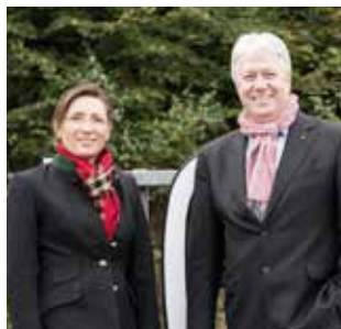
»ENERGIECOMFORT ist DER Immobiliendienstleister für Nachhaltigkeit und Energieeffizienz.«

Ein Energie-Managementsystem beinhaltet u.a. die Führung einer Energiebuchhaltung über jedes »konditionierte« Gebäude und die Erstellung eines jährlichen Berichts. Der Energiedienstleister