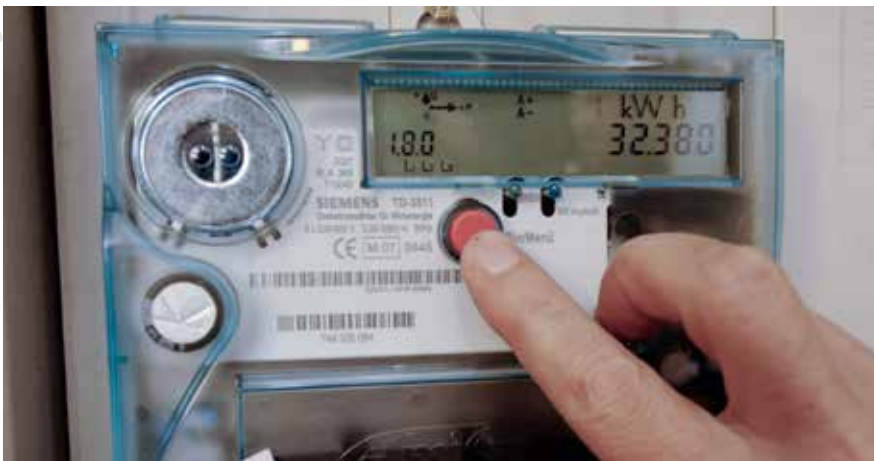
Die durch die smarten Zähler massenhaft anfallenden Daten ließen sich auch durch Dritte gewinnbringend verwerten – wovon Datenschützer seit jeher eindringlich warnen.

Eine deutsche Ernst & Young-Studie sieht im Smart-Meter-Rollout eine massive Mehrbelastung der Kunden – und empfiehlt treuherzig die Vermarktung der anfallenden Kundendaten.