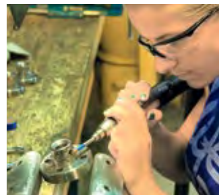
Technisches Verständnis ist unabhängig vom Geschlecht.