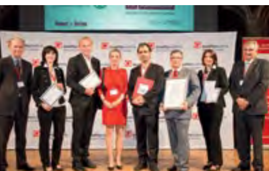
ÜBER DIE AUSZEICHNUNG »Committed to Excellence« dürfen sich das Joanneum Graz, die Kunstuniversität Graz, das Landeskrankenhaus Gmünd und die movement Personal- und Unternehmensberatung GmbH freuen.