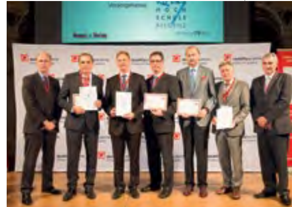
»RECOGNISED TO EXCELLENCE« sind die VBV Vorsorgekasse AG, das WIFI-Kärnten, die VHS Bregenz und der Wiener Krankenanstaltenverbund.