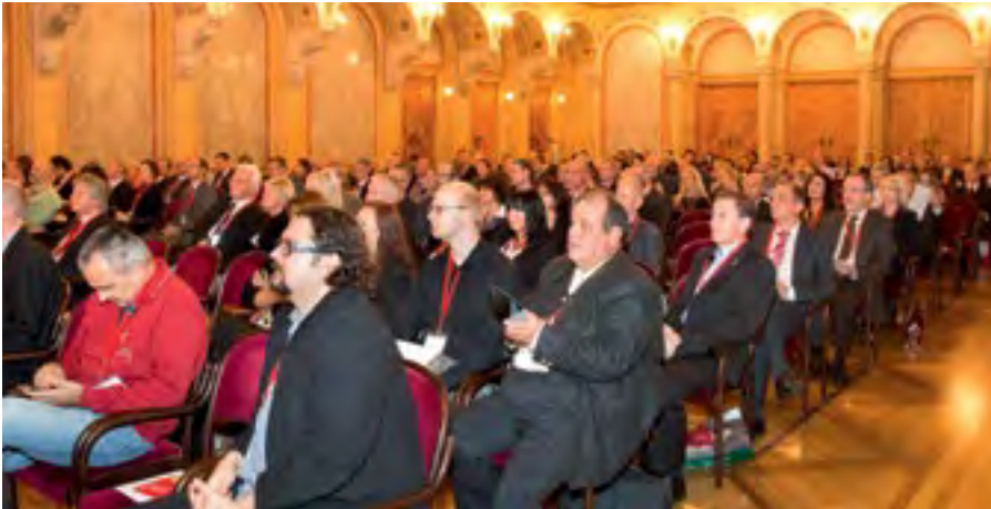
DAS PALAIS FERSTEL bildete den würdigen Rahmen für die Verleihung des Austrian Excellence Awards 2013.