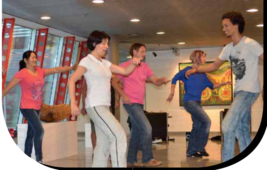
»Scharf bewegen« lautete das Motto des Gesundheitsprojektes X'undschaft, mit dem Würth die Mitarbeiter in Schwung brachte.

Unternehmen, die sich trotz aller Schwierigkeiten auf diese Erwartungen einstellen, können im Kampf um die besten Mitarbeiter zweifellos Wettbewerbsvorteile erringen. Der Chemiekonzern BASF investiert derzeit