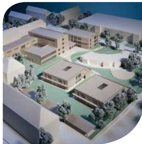
WORK-LIFE-MANAGEMENTZENTRUM. BASF investiert 18 Millionen Euro für die Gesundheit und Fitness der Mitarbeiter.

der Schweiz (25 %) und Österreich (13 %) beteiligten sich diesmal an der Umfrage mit dem Schwerpunktthema Mitarbeiterbindung. In der Prioritätenliste zeigt sich dabei ein Talking-Action-Gap: Zwar bewertet ein knappes Drittel der Befragten die Etablierung einer Work-Life-Balance als eines der zentralen HR-Themen, konkrete Maßnahmen beschränken sich jedoch überwiegend auf die »klassische« flexible Gestaltung der Arbeitszeit, die das Gleichgewicht zwischen beruflicher und privater Sphäre herstellen soll. Einem variablen Arbeitszeitvolu-