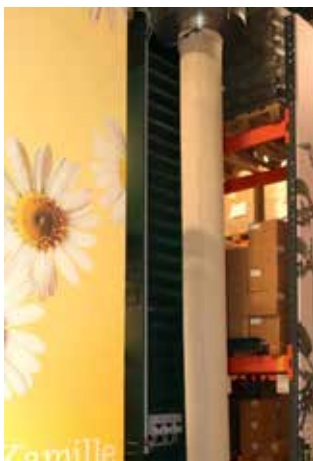
Trick mit dem Rüssel bei Hallenheizer von Gasokol.

Der Waldviertler Kräuter- und Gewürzspezialist Sonnentor setzt auf die energieeffizienten Hallenheizgeräte von Gasokol. Mit den neuen Geräten können bis zu 50 Prozent der Energiekosten eingespart werden. Während herkömmliche Hallenwärmer nur durch hohen Energieaufwand die Warmluft von der Decke bis ganz nach unten bringen, schaffen es Gasokol-Hallenheizer durch den bis knapp über den Fußboden reichenden Heizrüssel. Zentrales Funktionselement ist ein hocheffizienter Spirotherm-Wärmetauscher. Dieser saugt kalte Luft im