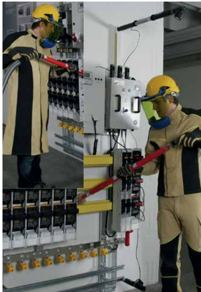
»DEHNcare« – störlichtbogengeprüfte Schutzausrüstung.