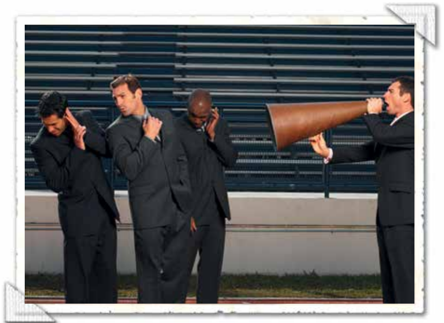
HOTSPOT FÜR LOBBYISTEN. In Brüssel sind 30.000 »Einflüsterer« unterwegs.

Neu sind solche Vorwürfe nicht. Dass die Expertengruppen ziemlich industrielastig agieren, räumte überraschend freimütig EU-Binnenmarktkommissar Michel Barnier anlässlich der Privatisierungsdebatte um das Wasser laut Medienberichten erst kürzlich ein. Die Expertengruppen sollten laut Barniers tatsächlich ausgeglichener besetzt sein. Lobbyisten schreiben nicht nur in Brüssel die Gesetze gleich selbst. In Österreich wird – unter der Hand – etwa die Hausbriefanlagenverordnung als Werk von Konzernjuristen gehandelt. Dass die Briefkastln so